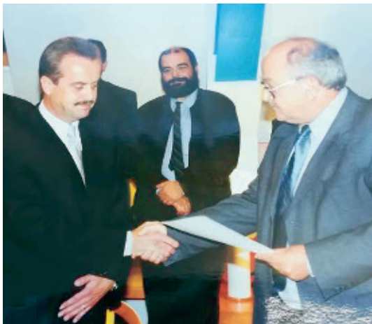
Angelobung am 26. September 2000