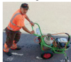
Ein Bauhofmitarbeiter bei der Unkrautbekämpfung.

Die Gemeinde St. Florian verwendet schon seit Jahren keine Herbizide mehr für die Pflege der Gemeindeflächen und leistet somit einen wichtigen Beitrag zum Insekten- und Naturschutz.