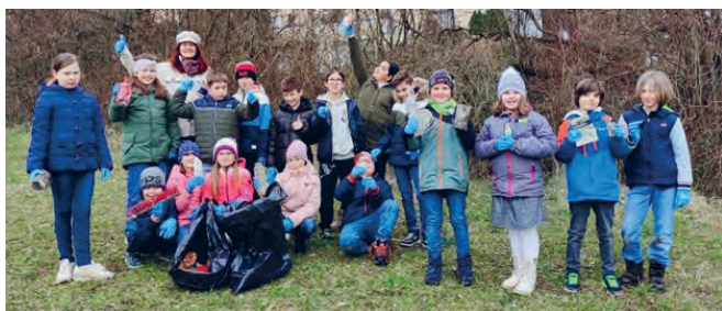
In diesem Sinne beteiligt sich die Volksschule auch jedes Jahr an der Flurreinigungsaktion.

Was lernen unsere Volksschulkinder zu den „vielfach strapazierten“ Themen der heutigen Zeit? Wie gehen wir mit Reizwörtern, anderen Meinungen und ethischen Grundfragen um? Wie können wir hier das wichtigste Potential unserer Gesellschaft, unsere Kinder, gut vorbereiten?