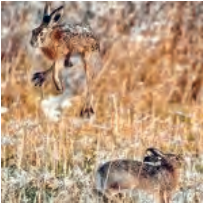
Oft wiederholt sich das spektakuläre Liebesspiel Der Feldhasen mehrfach. Daher galt der Feldhase schon in der Antike als Sinnbild für Fruchtbarkeit – und wurde Letztlich auch zum Osterhasen.

Womit sich erklärt, warum bereits ab Anfang Februar, doch richtig ersichtlich im März, die Langohr-Kinderstube mitunter schon gut gefüllt ist. Doch das Überleben wird den März-Häschen nicht leicht gemacht, denn nasskalte Witterung und Fressfeinde von Rabenvögeln über den Fuchs bis zur Hauskatze setzen ihnen in der noch deckungsarmen, intensiv genutzten Landschaft zu. Dazu kommt mit Beginn der ersten wärmeren Tage der „Risikofaktor“ Mensch. Falsch verstandene Tierliebe wird dem Hasen-Nachwuchs nämlich nicht selten zum Verhängnis.