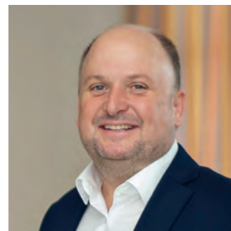
Bürgermeister Bernd Schützeneder

Das Denken in Kompromissen, die Einbindung aller Beteiligten bei zukunftsstrategischen Fragen, das Anhören unterschiedlicher Meinungen, das Abwägen sämtlicher